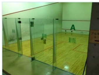
旧スカッシュルーム