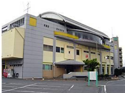
ウィングススポーツクラブ下関店