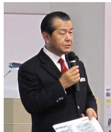
▲ 会社説明を行う弊社社長