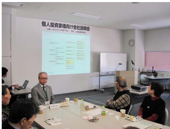
▲ 第3部の懇親会に出席した役員