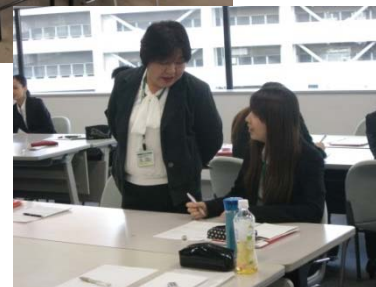
▲ 札幌市から受託した事業「ジョブスタートプログラムジュニア」の研修風景