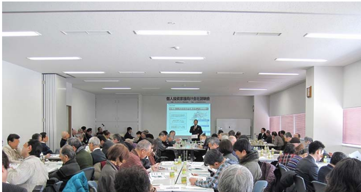
◀ 第一部 会社説明会の様子