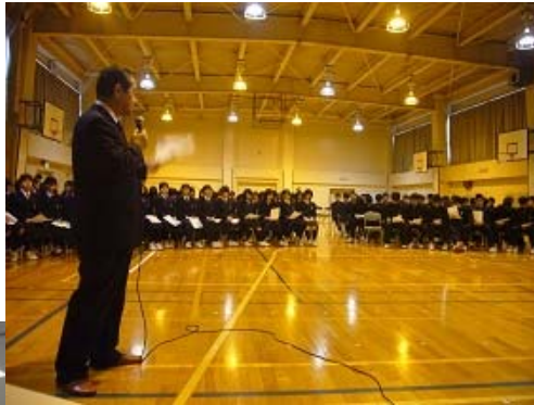
▲母校 柏中学で「読売ゆめ授業」の講演を行う社長

私たちは、CSRの一環として、ビジネスセミナーや文化活動、就職フェアなどを開催しています