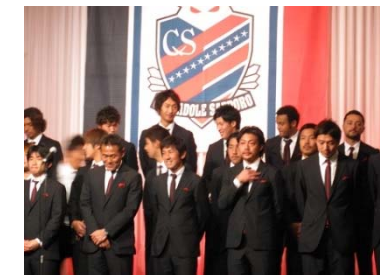
▲ 当社がスポンサーのコンサドーレ札幌のイベント風景