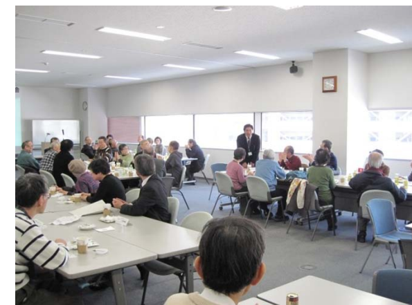
▲ 懇親会に同席する際に挨拶する役員