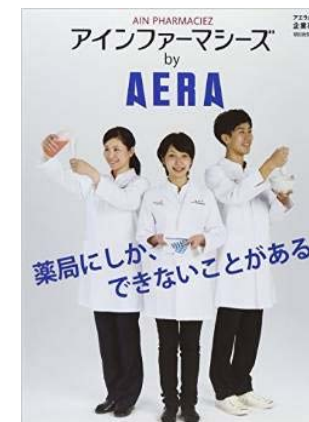
「アインファーマシーズ by AERA」

2015年9月に「アインカレッジ」を開講。自習室、ラウンジを完備し、国家試験合格へ向けて、勉強に集中できる環境を提供する。