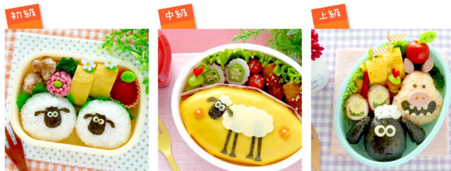
ふっくらまんまる♡ショーンの簡単おにぎりお弁当