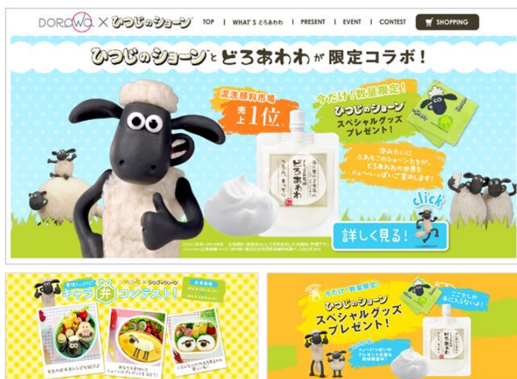
「DOROWA×ひつじのショーン スペシャルコラボサイト」OPEN