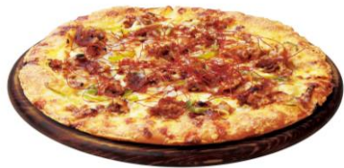
旨みギュッとブルコギ