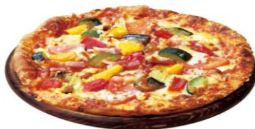
熟成ベーコンとグリル野菜