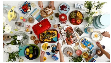
ブルーノ BRUNO (インテリア商品ブランド)