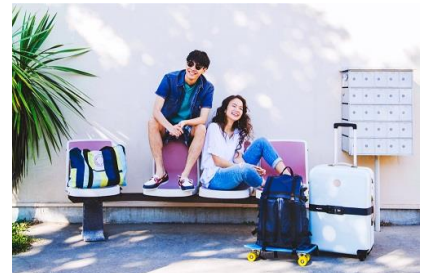
MILESTO ミレスト EVERYDAY TRAVEL (トラベル雑貨ブランド)