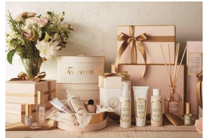
Ferracure テラクオーレ Organic Cosmetics (オーガニックコスメブランド)