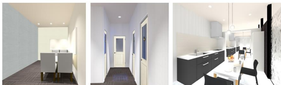
▲RIZAP ENGLISH セッションブース 店舗内にはテストルームや自習スペースも