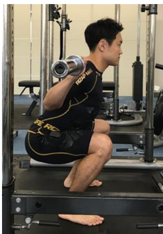
図 1 : 正しいスクワット