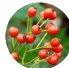
ローズフルーツエキス *3

ブルガリア酸ローズはちみつを発酵させた時にできる「発酵ローズはちみつ」 *3 は、天然のAHAと呼ばれるグルコン酸を含みます。マイルドなピーリング作用で、肌のザラつきを優しくケアします。