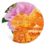
発酵ローズはちみつ *3