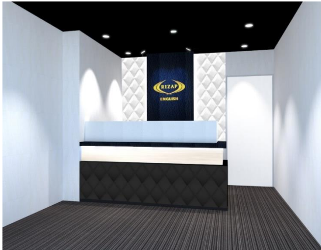
RIZAP ENGLISH 店舗数推移