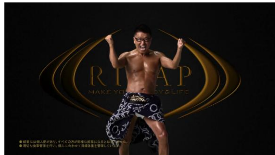
【RIZAP 公式 HP にて動画公開】・『BA 生島ヒロシ』篇： http://www.rizap.jp/cm/