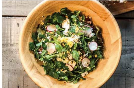
パクチーたくさんデトックスサラダ

サニーレタス、グリーンリーフ、水菜、トレビス、ロメインレタス、レッドオーク、むき海老、モッツァレラチーズ、卵、鶏ささみ(もほろ)、ブロッコリー、ブルーチーズ、人参、ズッキーニ、きゅうり、ヘンプナッツ