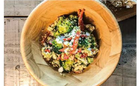
ヘンプナッツのスーパーフードサラダ

カリフラワー、パクチー、鶏ささみ、卵、クレソン、ペビーリーフ、トマト、ヘンプナッツ、二十日大根、レーズン、ミント、焙煎ハナビラタケ